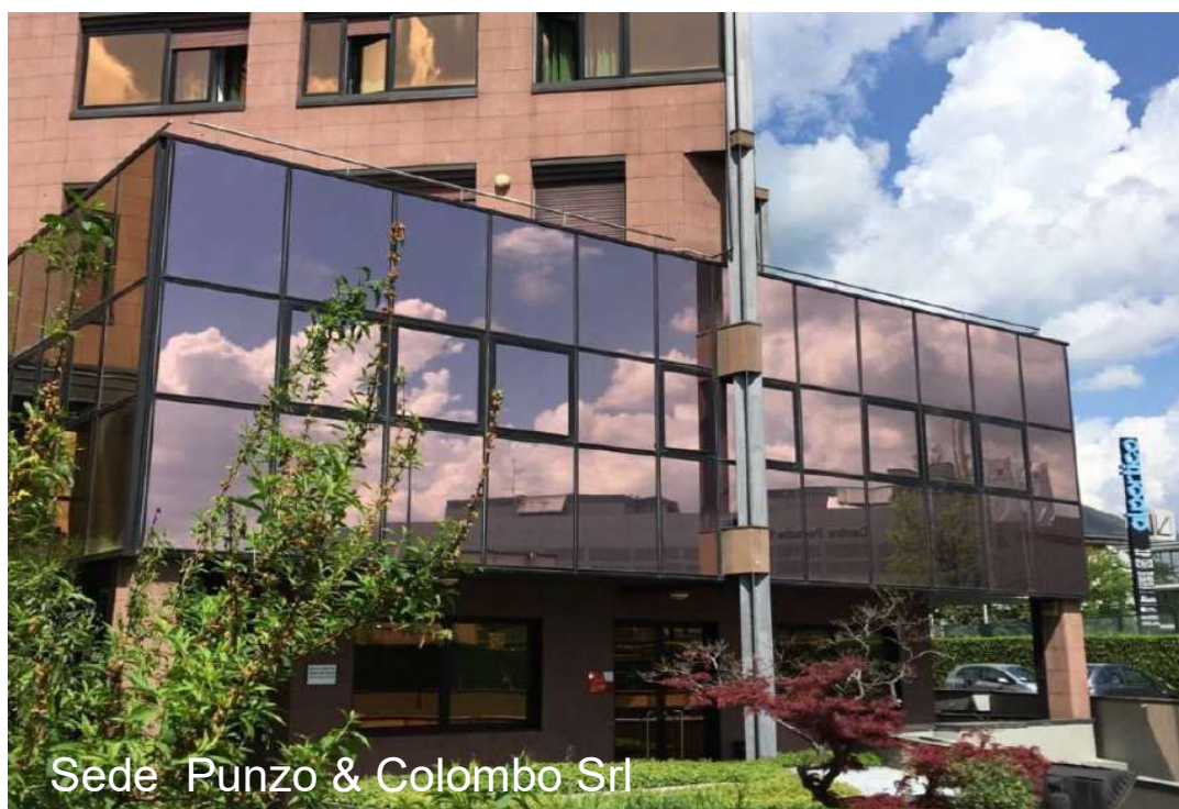
Sede Punzo & Colombo Srl

L'azienda investe continuamente nella formazione dei propri collaboratori, rafforzando e ampliando giorno dopo giorno il proprio know-how. Specialisti certificati e un efficiente gruppo tecnico consentono di rispondere in modo appropriato e competente, così che gli standard qualitativi di ogni tipologia di apparecchiatura e soluzione proposta siano sempre al massimo livello. Presso la nostra sede di Bergamo è anche attiva un'avanzata area demo dove la tecnologia Canon, le soluzioni e i prodotti che proponiamo sono a disposizione per dimostrazioni. E' uno spazio pensato per progettare assieme ai nostri clienti soluzioni su misura e trovare le risposte più adatte a ogni esigenza di business.